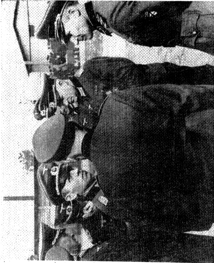
Le même homme au service d'une même cause. Gählen (l'officier à gauche) avec les officiers « Vlassovistes » en uniforme allemand durant la guerre contre l'Union Soviétique. Et Gählen, chef des services d'espionnage de la République Fédérale Allemande.

דער אמתער שפך פון די וולקאטוועס. גענעראל געלען צווישן די שטאבס-לייט פון ר. א. א. אין שעדענע פילן אין 1943.